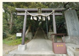
「坂戸神社古式祭典図巻」は市指定文化財