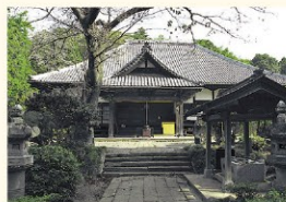
神亀元年(724年)に行基によって創建された古刹