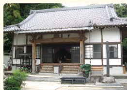
新上総国三十三観音霊場第二十七番札所