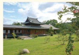
緑あふれる「樹木葬」の寺院