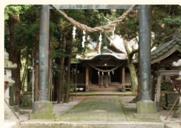
権現造りの社殿は市の有形文化財